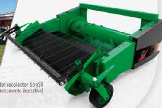
Vista isométrica del recolector 609SR (3D meramente ilustrativa)