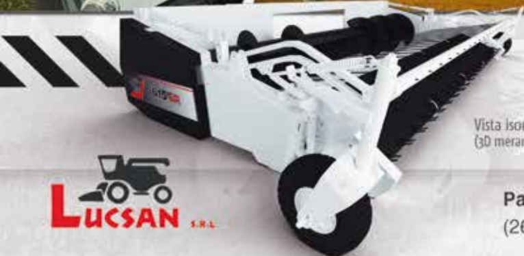
Vista isométrica del recolector 615SR (3D meramente ilustrativa)